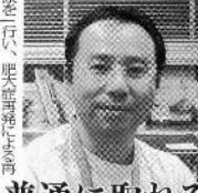
前立腺肥大は男性の宿命ともいえる病気